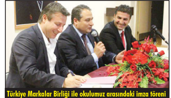
Türkiye Markalar Birliği ile okulumuz arasındaki imza töreni

Avrupa Birliği'ne girme çalışmalarının tekrar gündeme gelmesi ve hız kazanmasıyla beraber yabancı dil yeterliliği-